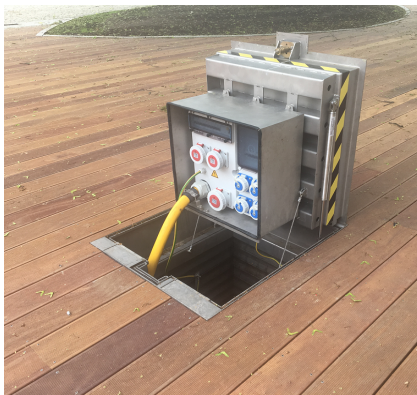
Snadné otevření víka s rozváděčem díky integrovaným plynovým pístům.