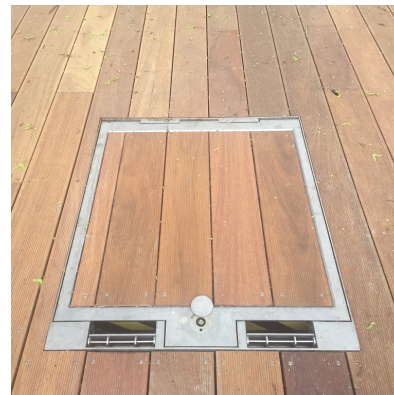
Kryt může být vyplněn betonem, dřevem nebo dlažbou.